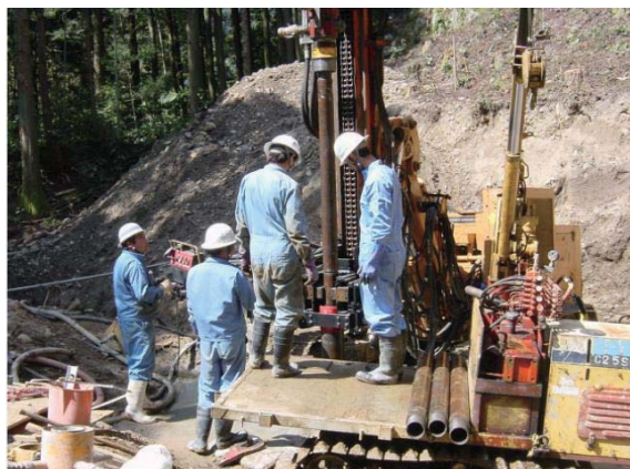
インナーロッド引抜き状況