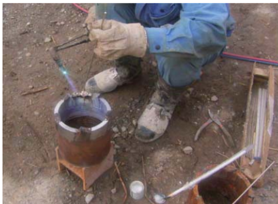
コンポジット溶接状況