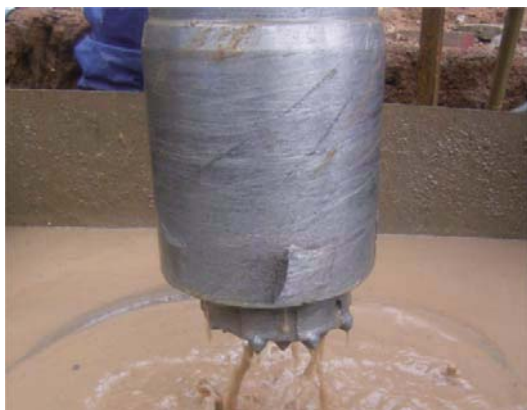
碎石削孔後の通常ビット摩耗状況