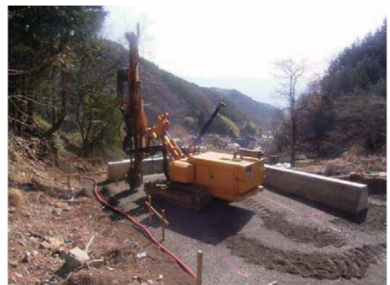
ボーリングマシン(クローラタイプ)