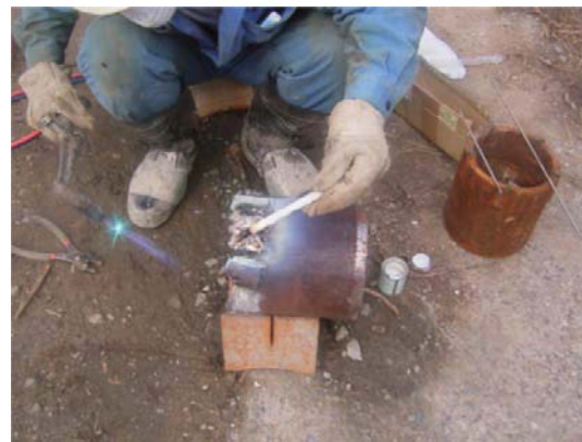
コンポジット溶接状況