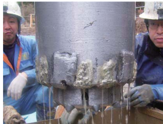
碎石削孔後の特製ビット摩耗状況