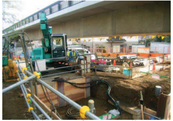
資材置場およびクレーン配置状況