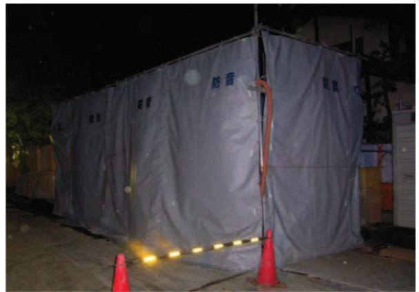
防音対策(プラント部)