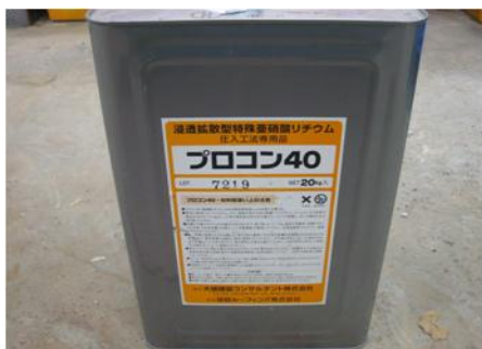
浸透拡散型亜硝酸リチウム「プロコン40」