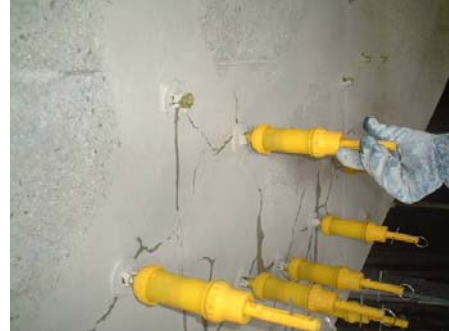
リハビリシリンダー