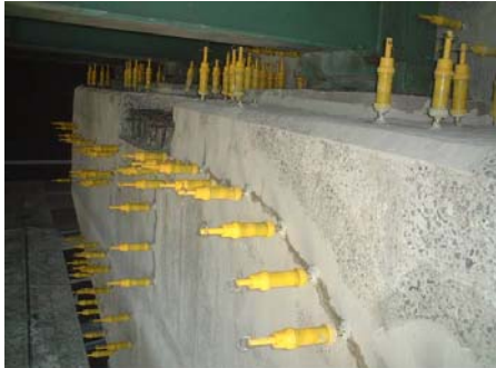
リハビリシリンダー工法施工状況