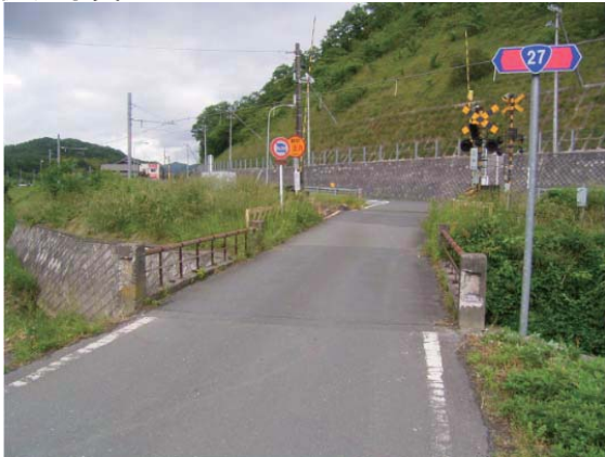
着工前全景(旧橋撤去前)