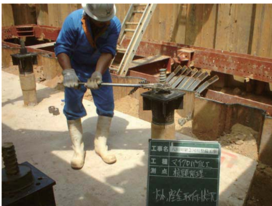
杭頭ロックナット取付