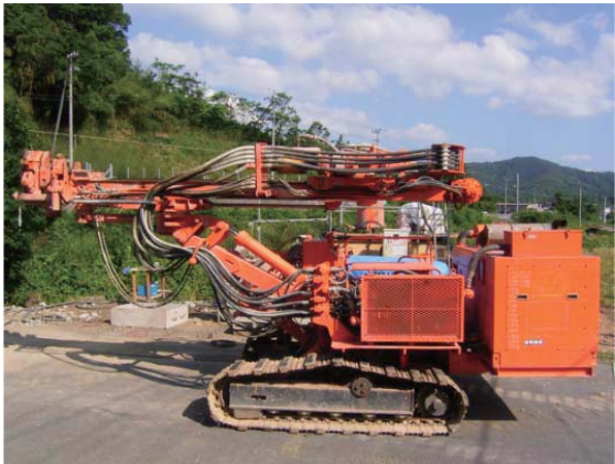
ボーリングマシン(RPD-130C)