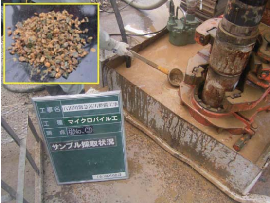
支持層土質サンプル採取