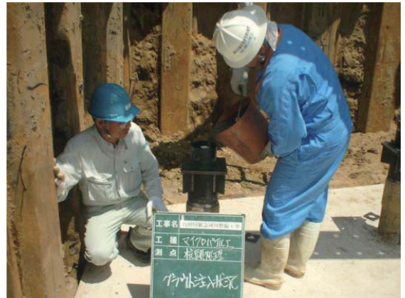
杭頭グラウト充填