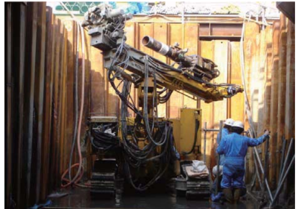
削孔機矢板締切内投入