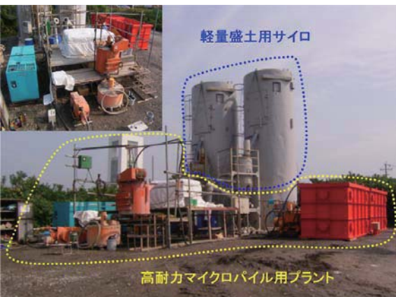
プラントおよびサイロ