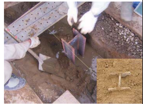
間詰め砂投入状況