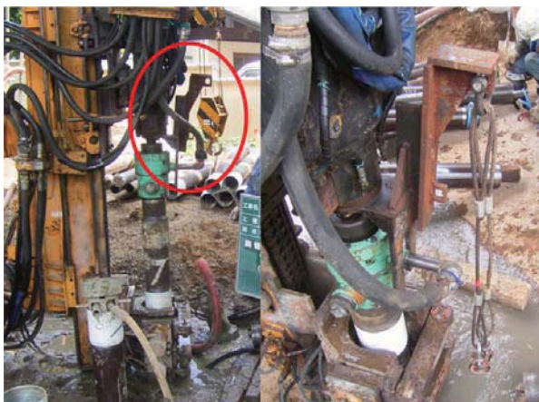
鋼管吊り込み治具