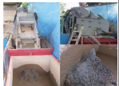
マッドスクリーン・スライム