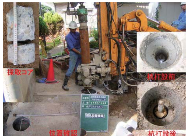
既設フーチング部先行削孔